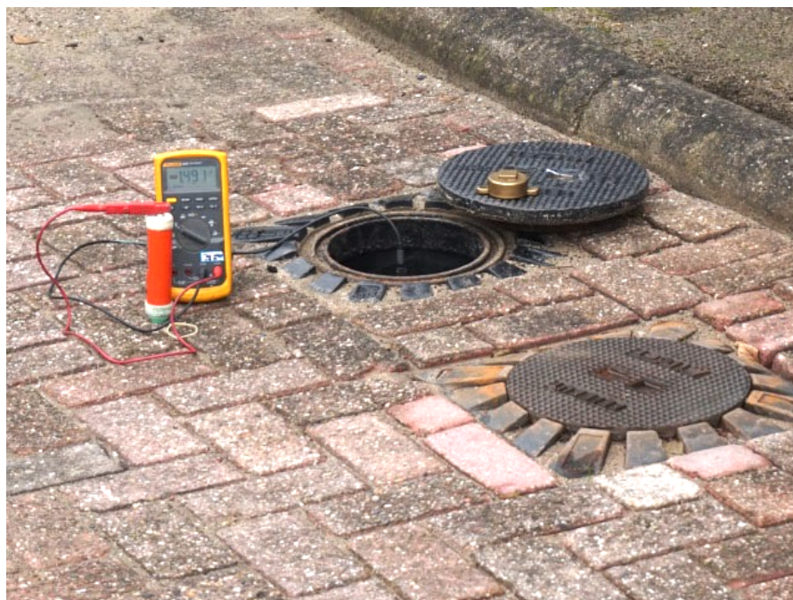
Voorbeeld van een Kb-meting.

De inspecteur plaatst bij het vaststellen van de MEP-in en de MEP-uit de \text{CuCuSO}_4 -referentiecel altijd zo dicht mogelijk boven de tank, in een vochtige bodem die aan het maaiveld visueel niet is verontreinigd met bijvoorbeeld morsproduct.